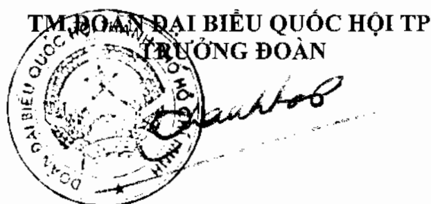
Huỳnh Thành Lập